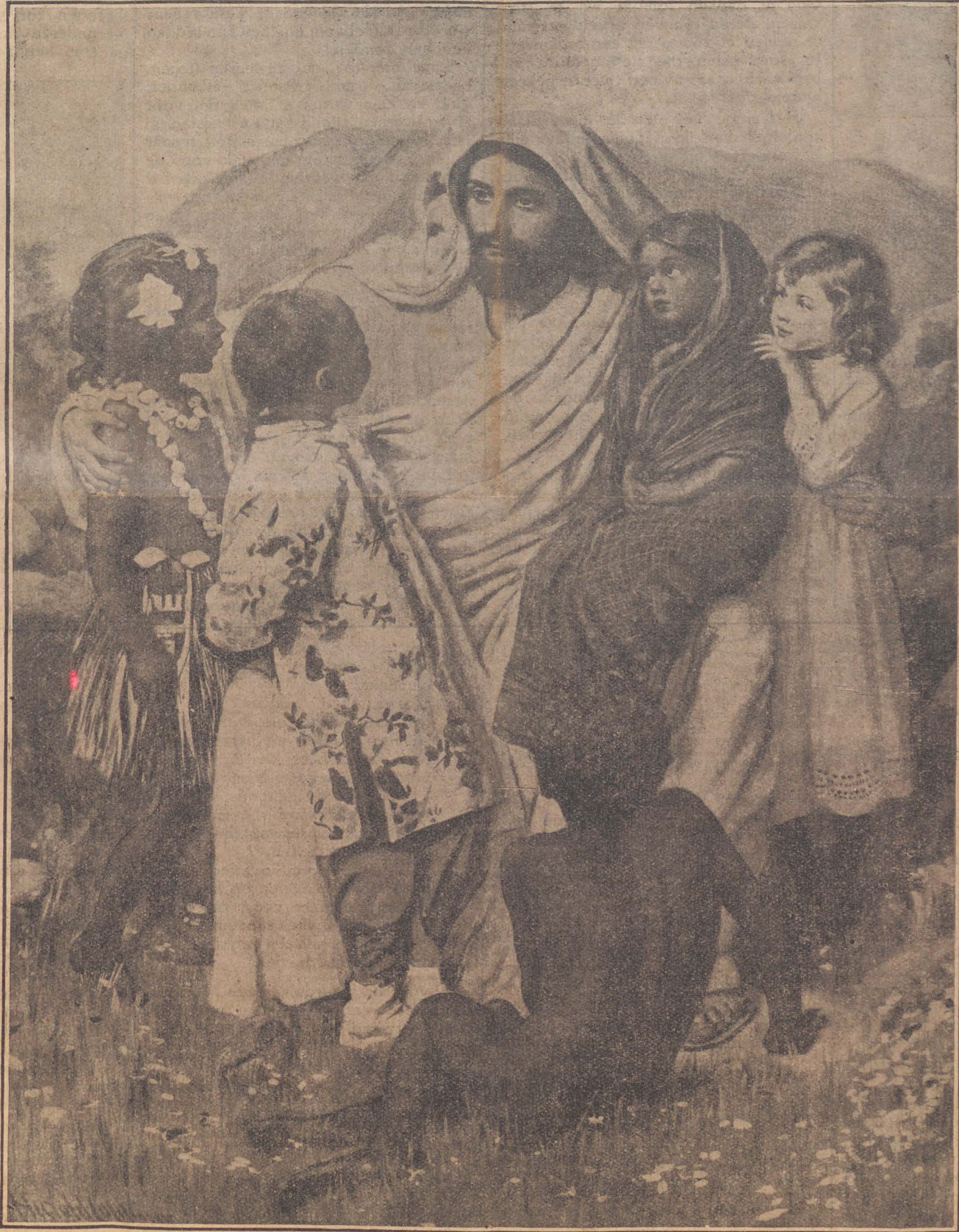
JEZUS, DE GROOTE KINDERVRIEND.

KOM EN HELP ONS, HEN TE WINNEN VOOR CHRISTUS! DOOR DEN GENERAAL.