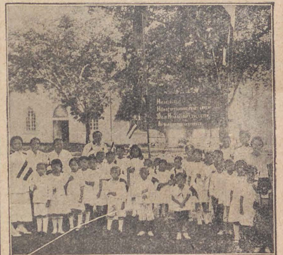
HET J. L.-KORPS VAN REMBANG.

Ja, dat is het! We moeten hen brengen tot God; wij moeten hen vergaderen in Zijn Koninkrijk. Wij moeten hen herstellen in het kindschap